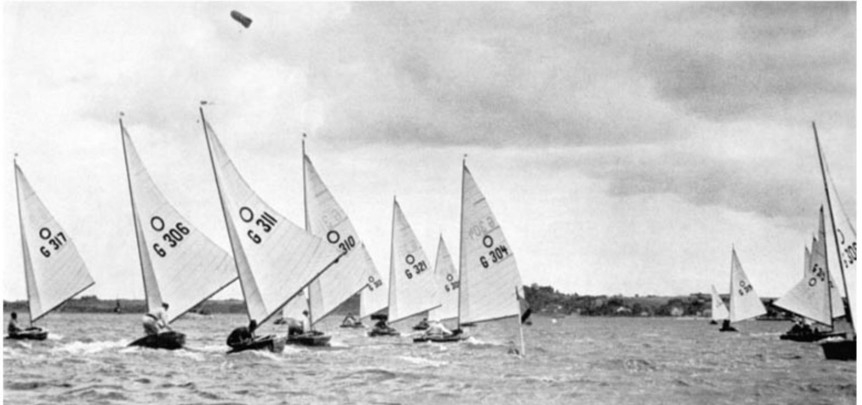
The oneman boats of the Olympic Monotype Class have turned and are running before the wind.