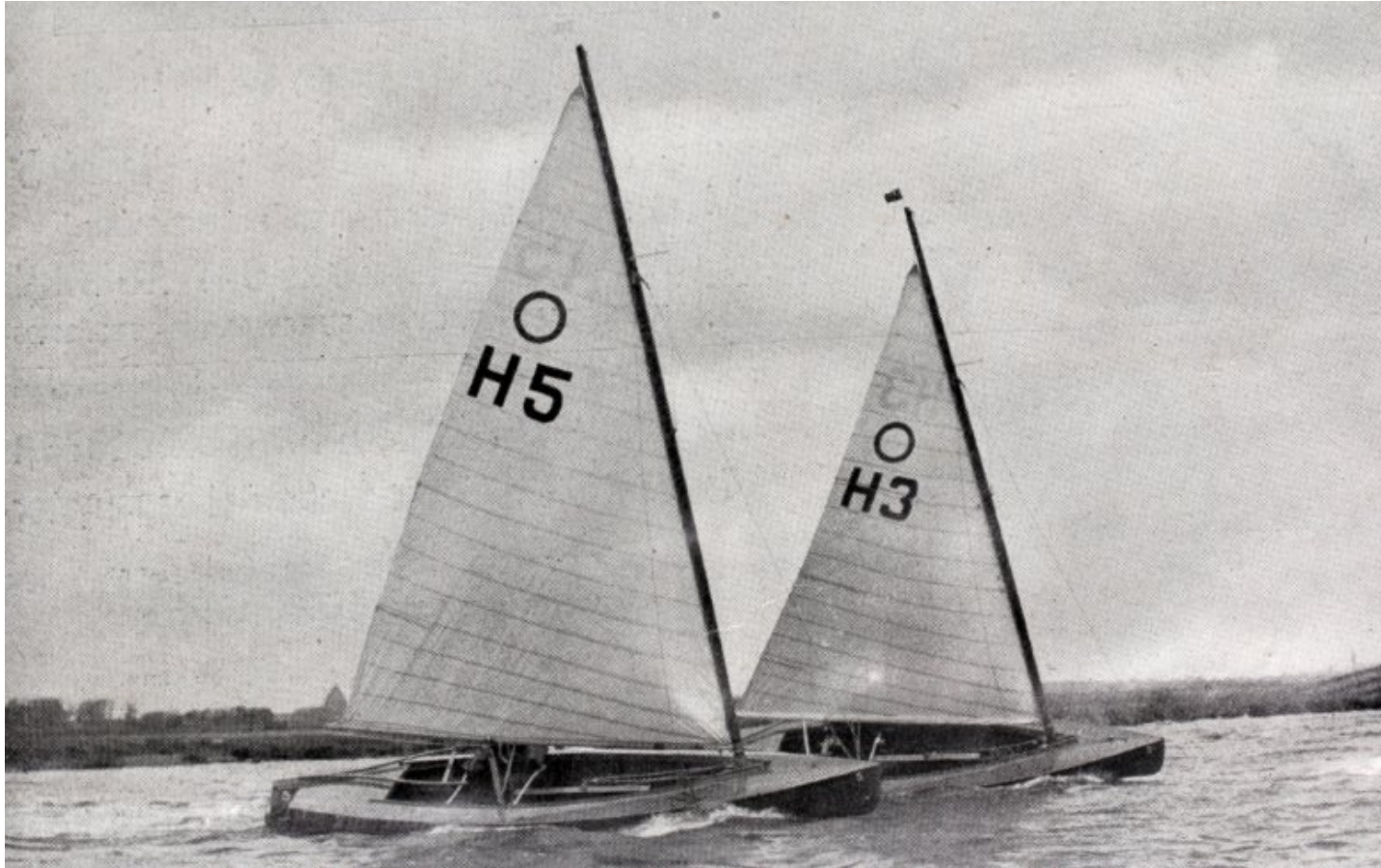
Twee verbonds jollen

1935-1936 op zoek naar de Olympische zeiler