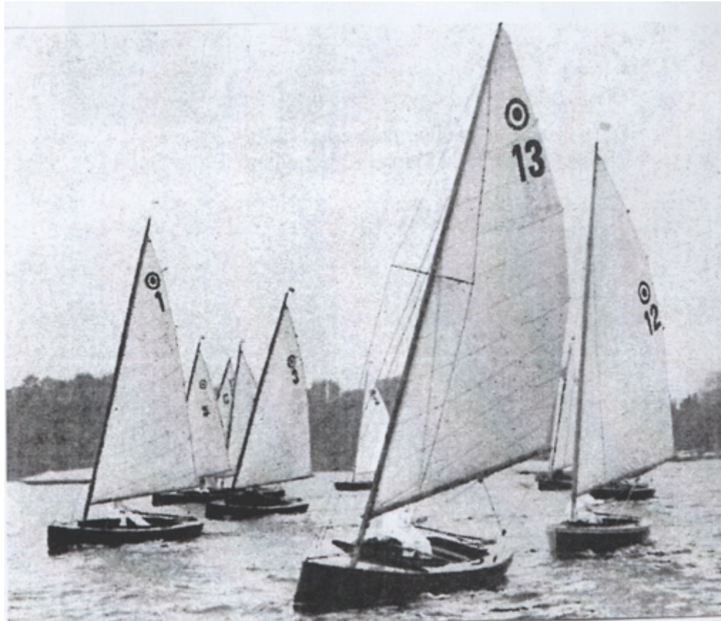
Enkele prototype jollen